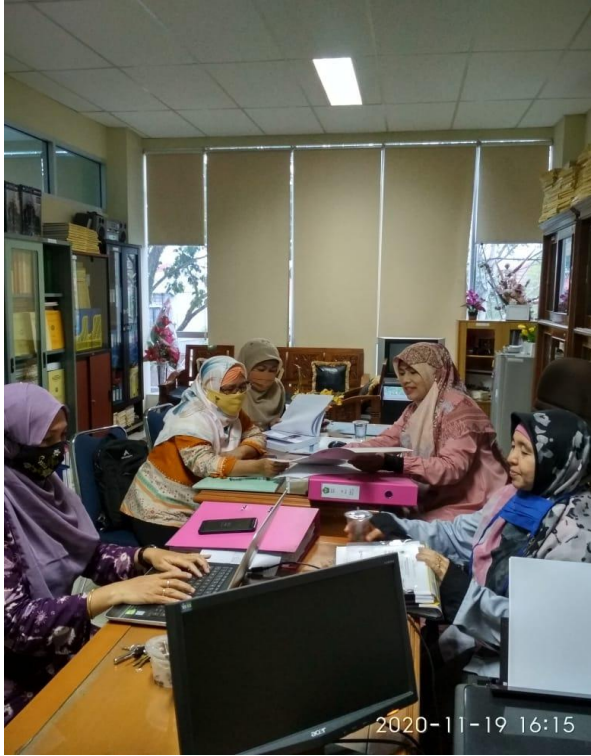
Foto Kegiatan Audit